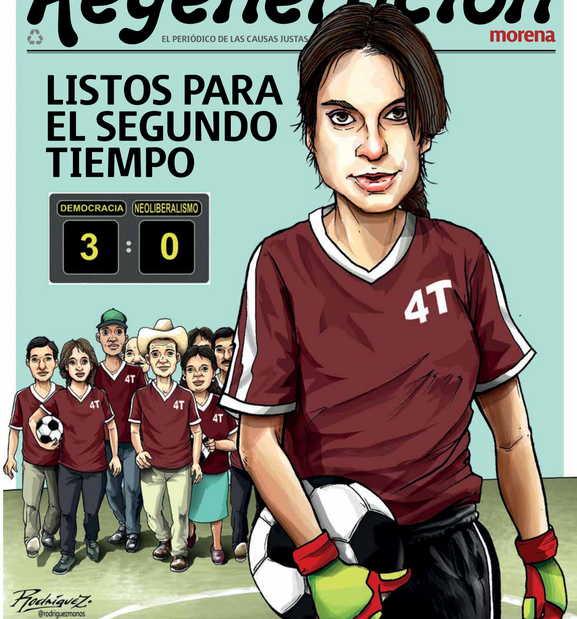
Ilustración Antonio Rodríguez