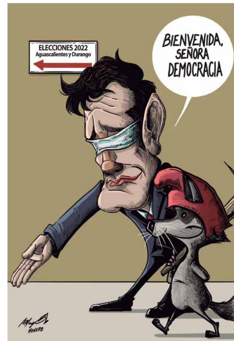
Cartón: Mayo Monero

No puede pasarse por alto que en Durango y Aguascalientes las diversas irregularidades cometidas por la derecha, el conservadurismo y el INE incidieron en los resultados finales de la elección