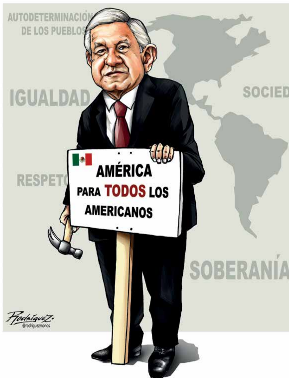
Cartón: Antonio Rodríguez

Como mexicanos, debemos estar orgullosos de eso. ♦