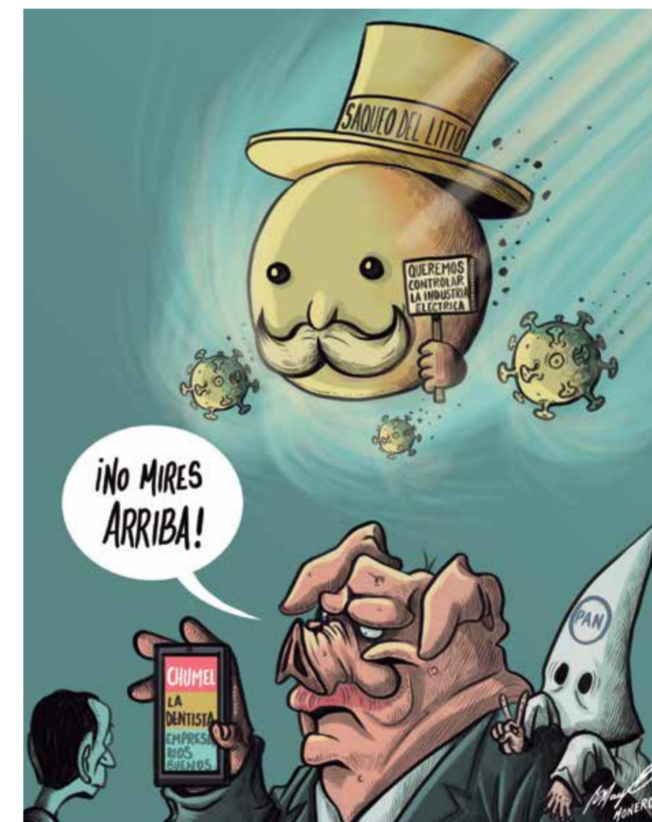
Cartón: Mayo Monero

En el documento Perfil del mercado del litio , la administración de Peña Nieto prácticamente anunciaba la entrega del