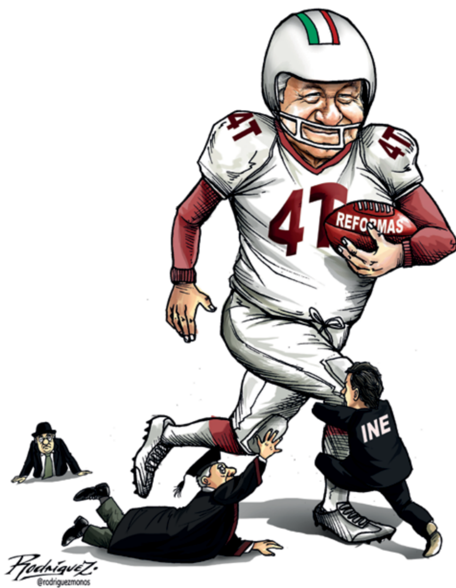
// A PUNTO DE LA ANOTACIÓN //

La derecha sabe que la Cuarta Transformación avanza y por más intentos que ha hecho para detenerla, no ha podido. La popularidad de Andrés Manuel López Obrador sigue creciendo