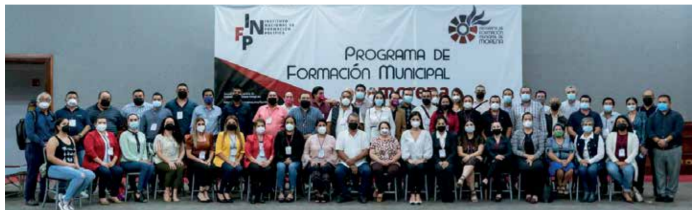
La capacitación a las diversas autoridades municipales que imparte el Instituto Nacional de Formación Política de Morena busca profundizar la transformación de México en los niveles más cercanos a la gente

Esa es la raíz, y esa es la sal de la libertad: el municipio. JOSÉ MARTÍ