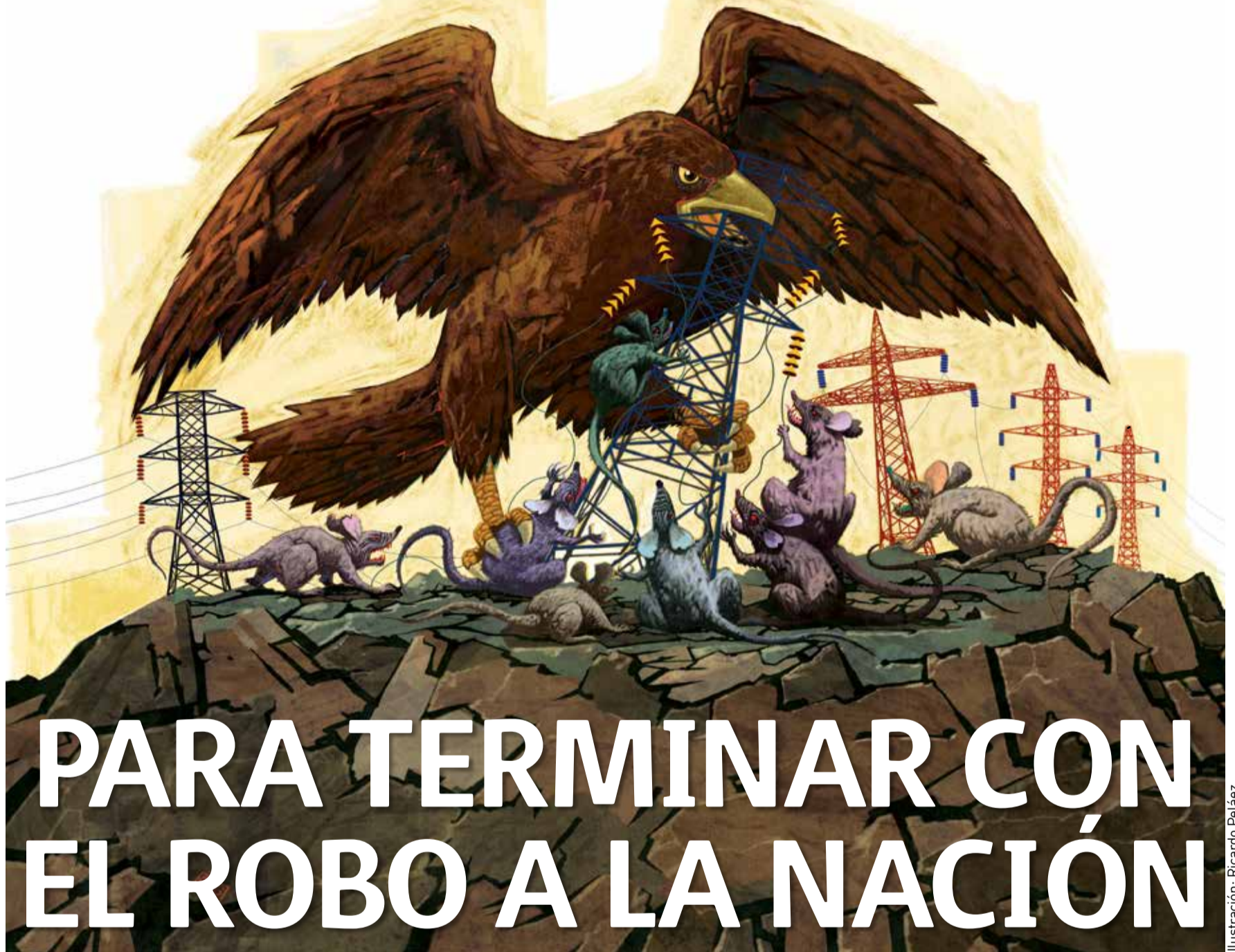
Ilustración: Ricardo Peláez