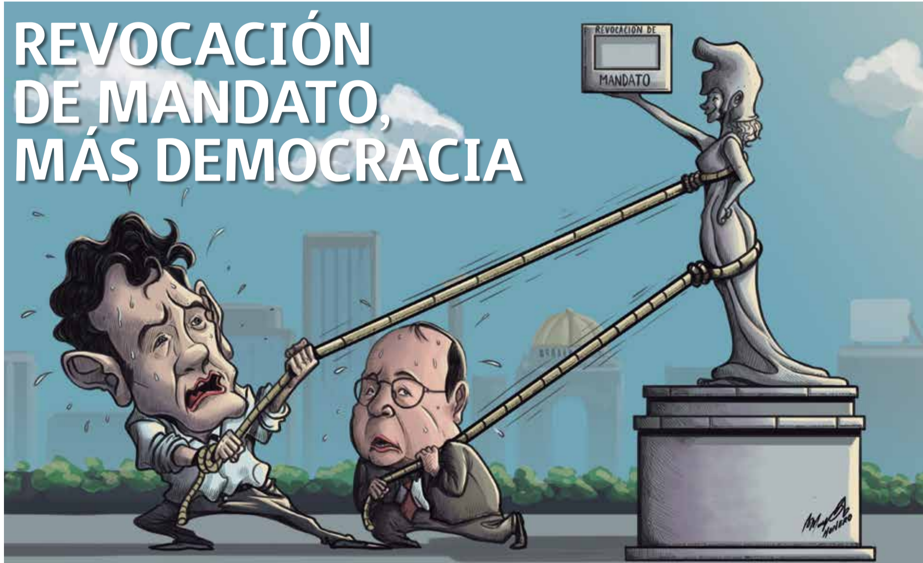
Ilustración: Mayo Monero