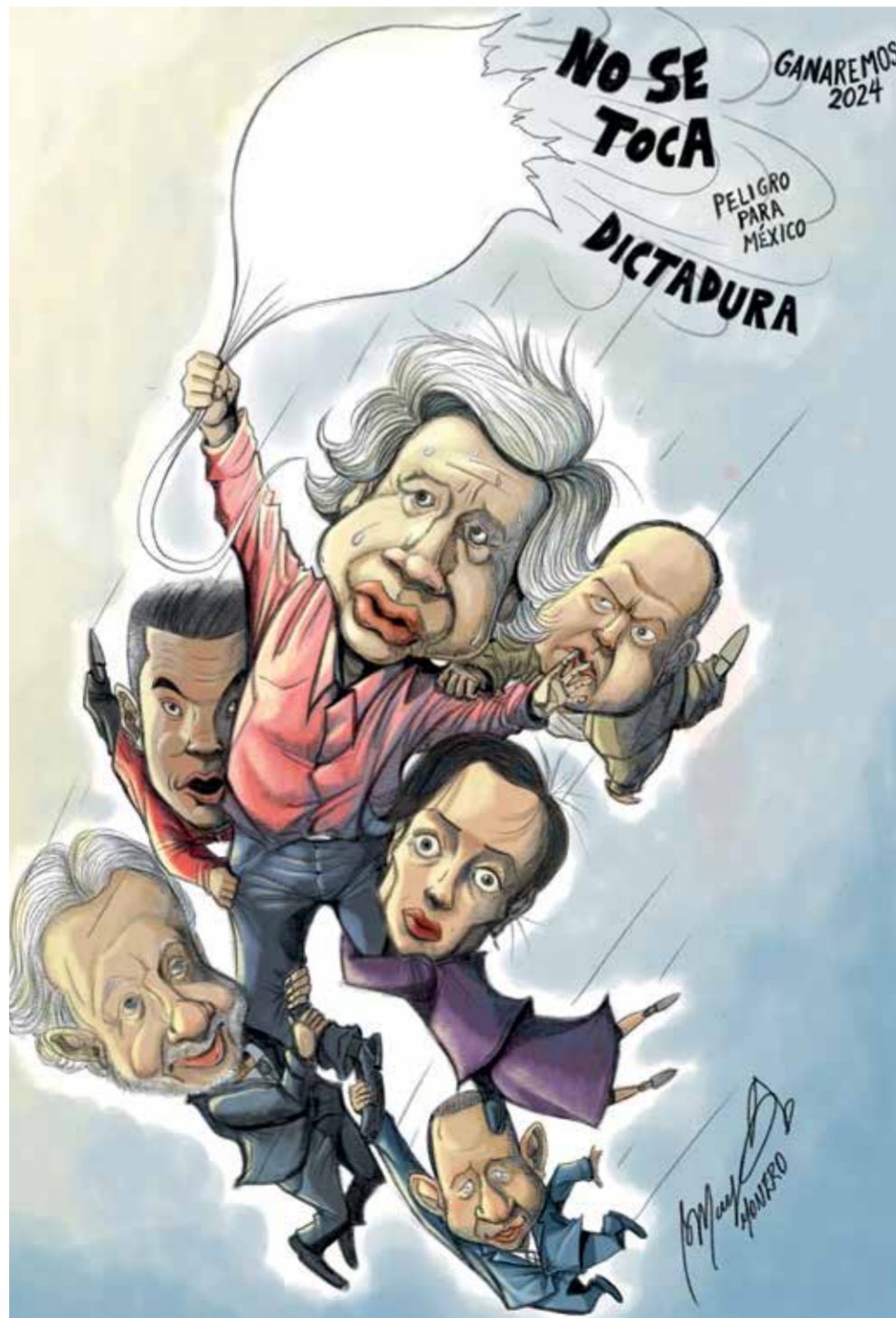
Cartón: Mayo Monero

Aquí desmontamos algunas de las muchas mentiras que difunden todos los días.