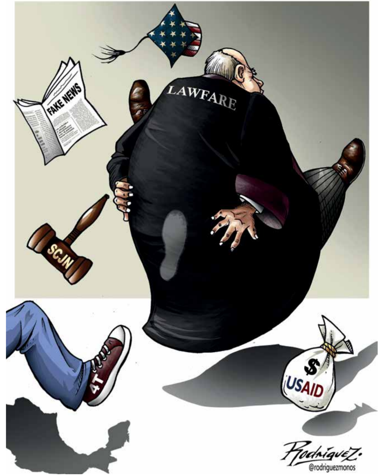
Cartón: Antonio Rodríguez

Es común que la mayoría de los ministros aprueben amparos que