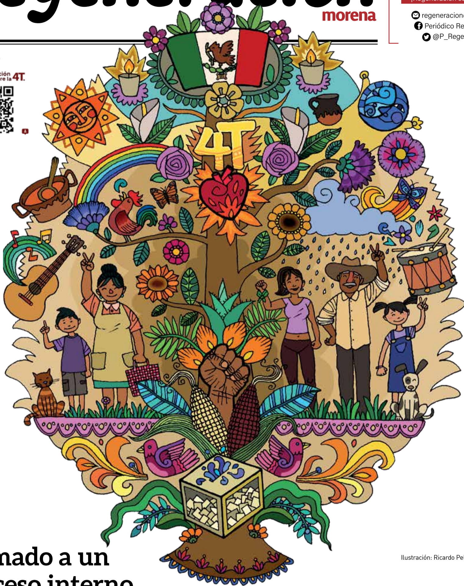
Ilustración: Ricardo Peláez