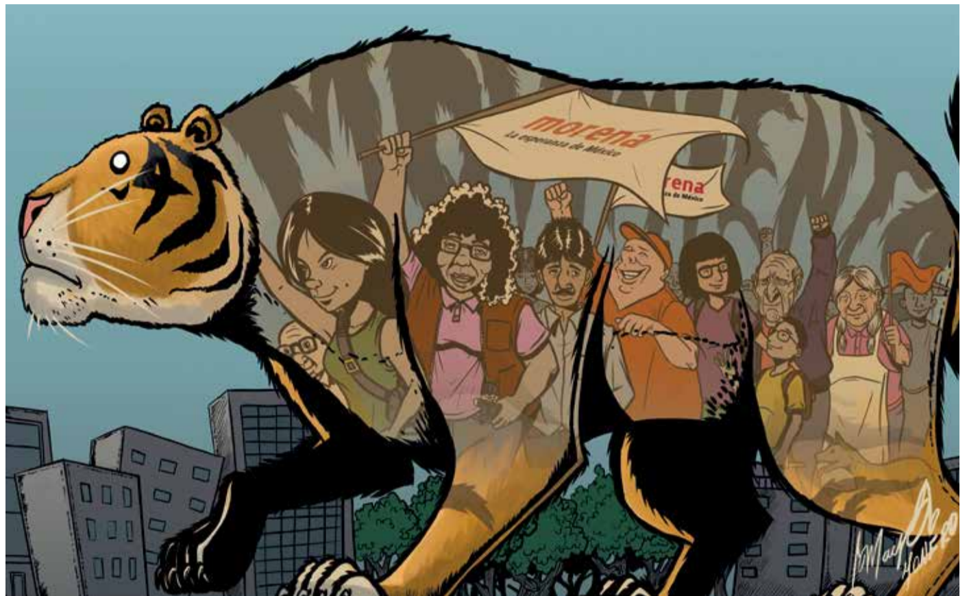
Ilustración: Mayo Monero

La Cuarta Transformación somos todos: estamos rescatando al país y no podemos, por ningún motivo, permitir que regresen los de siempre, los que dejaron a México a la orilla del abismo