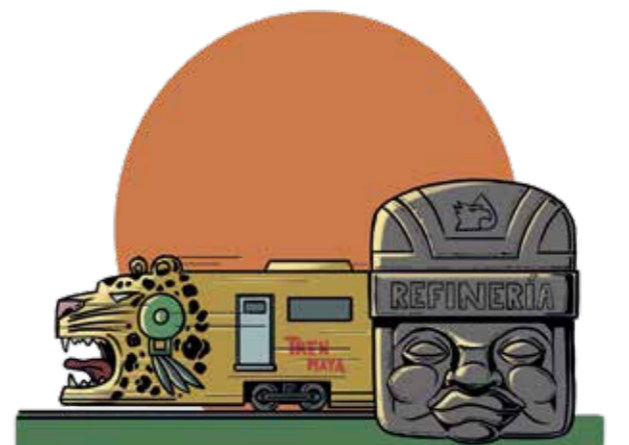
Ilustraciones: Ricardo Peláez y Mayo Monero

Para hacer todas estas obras no se ha pedido ni un peso de deuda.