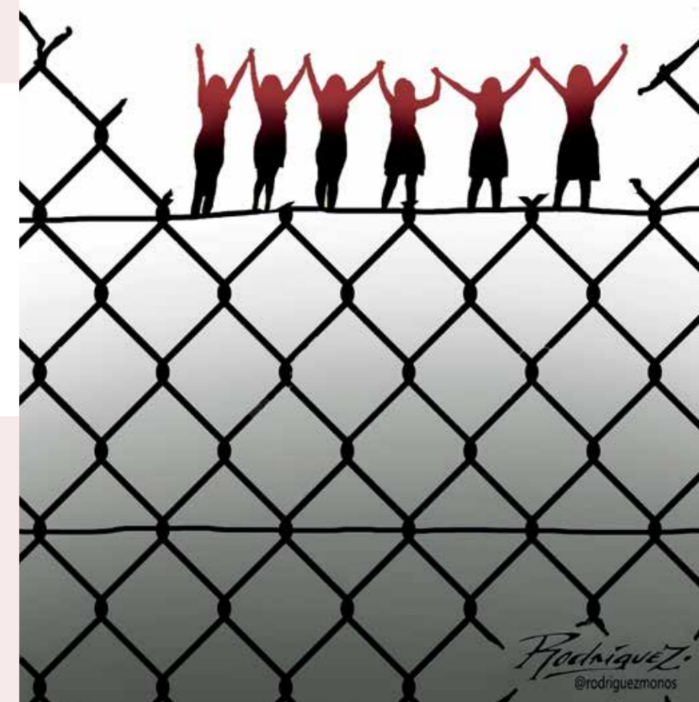
Ilustración: Antonio Rodríguez

A la 4T la integran movimientos sociales que luchan por los derechos sexuales y reproductivos. Aquí un breve recorrido de lo avanzado