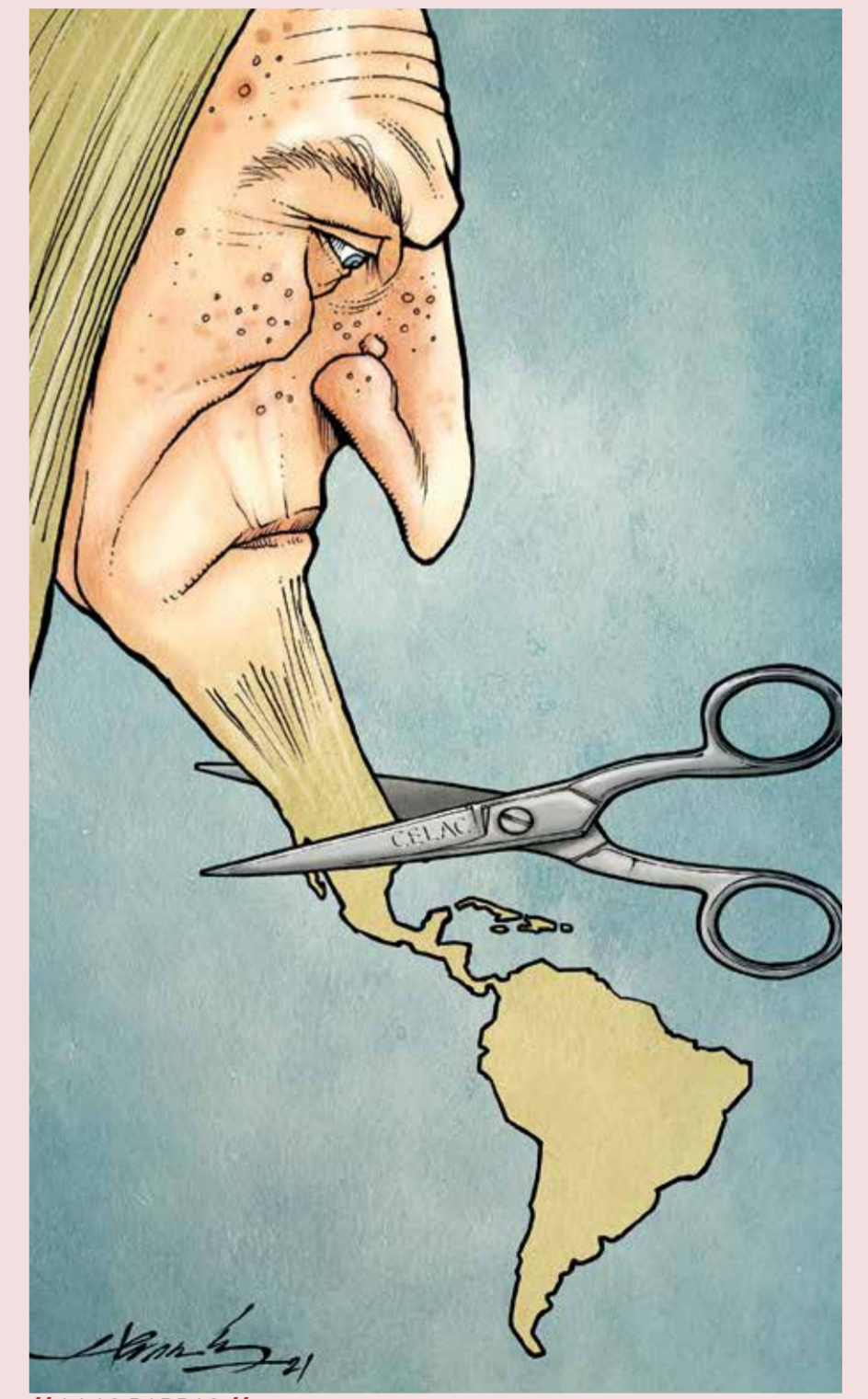
// A LAS BARBAS //

En suma, la cumbre de la CELAC colocó a nuestro país a la cabeza de América Latina en los esfuerzos por construir una región más justa, próspera y democrática, más integrada y mejor hermanada consigo misma. ♦