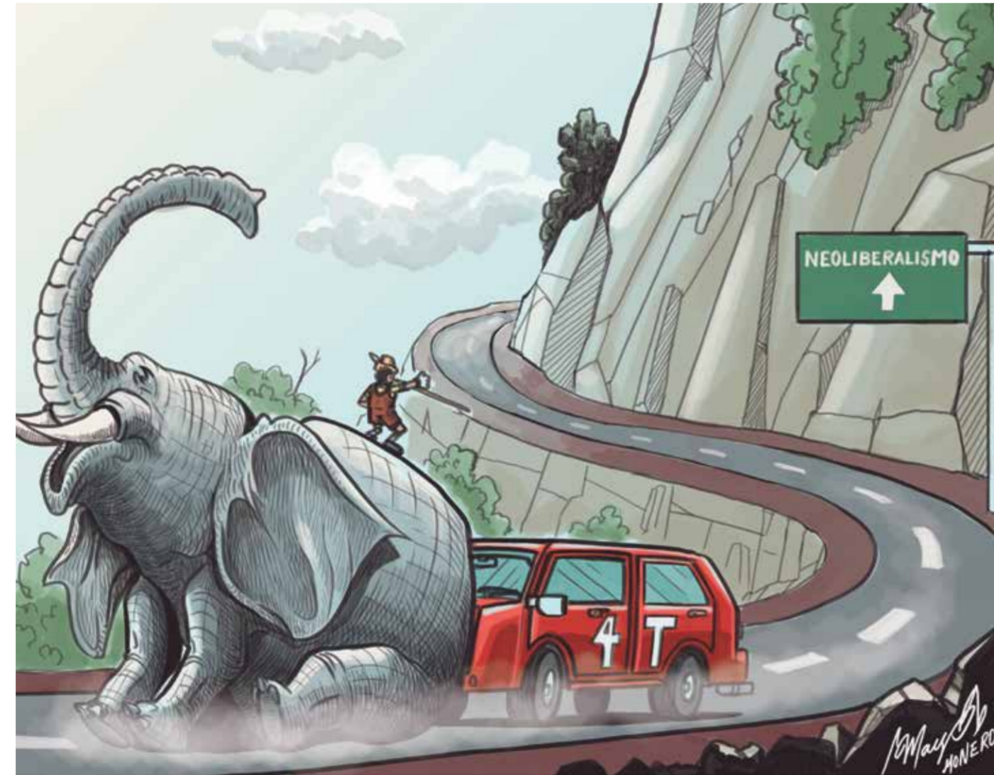
Cartón Mayo Monero

Estamos edificando la Cuarta Transformación, pero necesitamos afianzarla para que los conservadores nunca puedan echar atrás los logros que hemos tenido ya