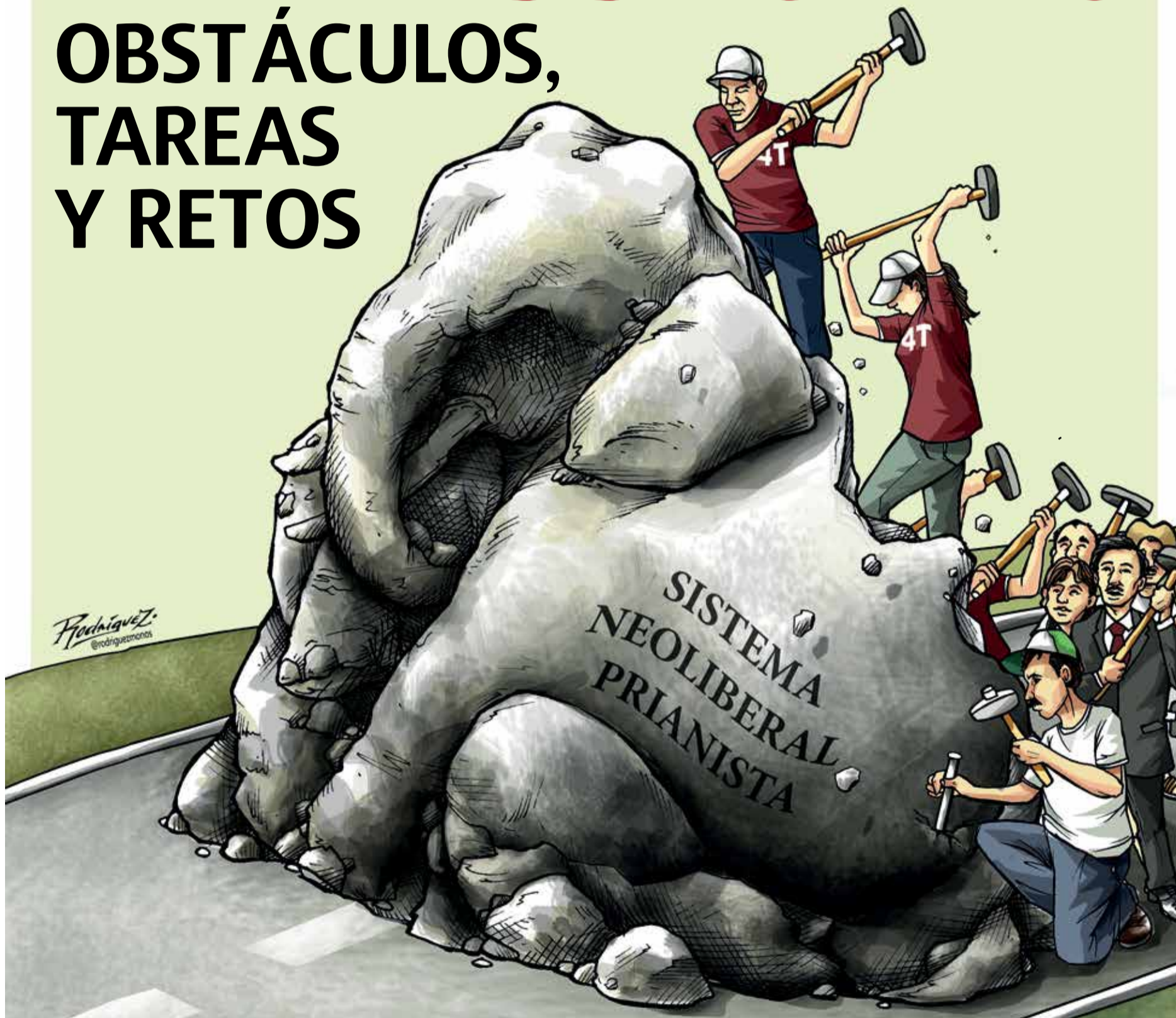
Ilustración Antonio Rodríguez

Morena tiene como su principal tarea profundizar la 4T y defender lo logrado hasta hoy