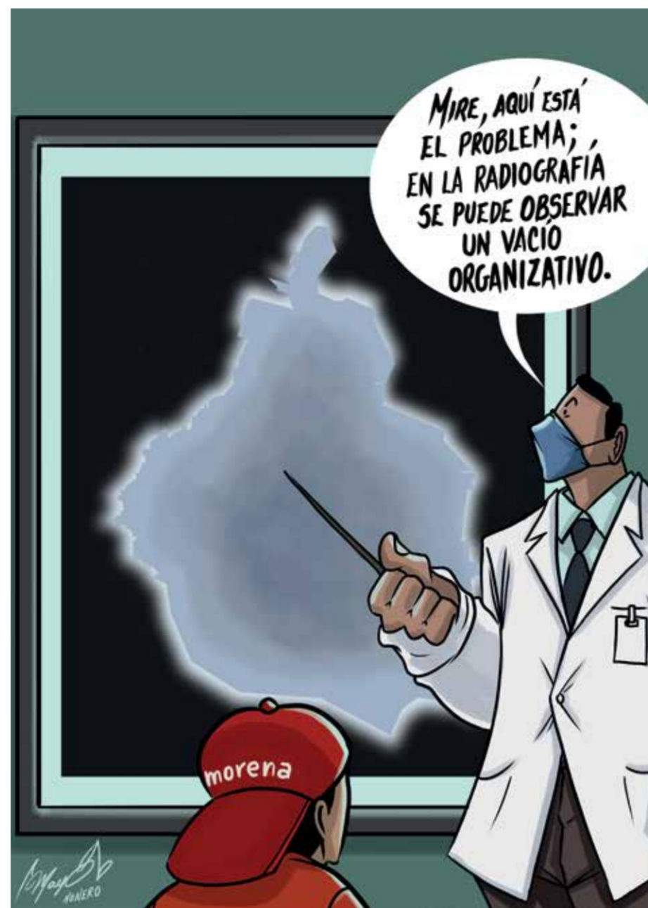
Cartón Mayo Monero

El contraste entre los resultados obtenidos para el legislativo local y los que se consiguieron en las alcaldías marca la existencia de un voto diferenciado que sólo puede explicarse por la debilidad de los aspirantes a las segundas, por el desempeño deficiente de los alcaldes salientes o por ambas razones. Esta diferencia deja ver, además, que en lo general se mantiene el respaldo del electorado a la 4T y a la jefa de Gobierno. Es significativo que el uso propandístico