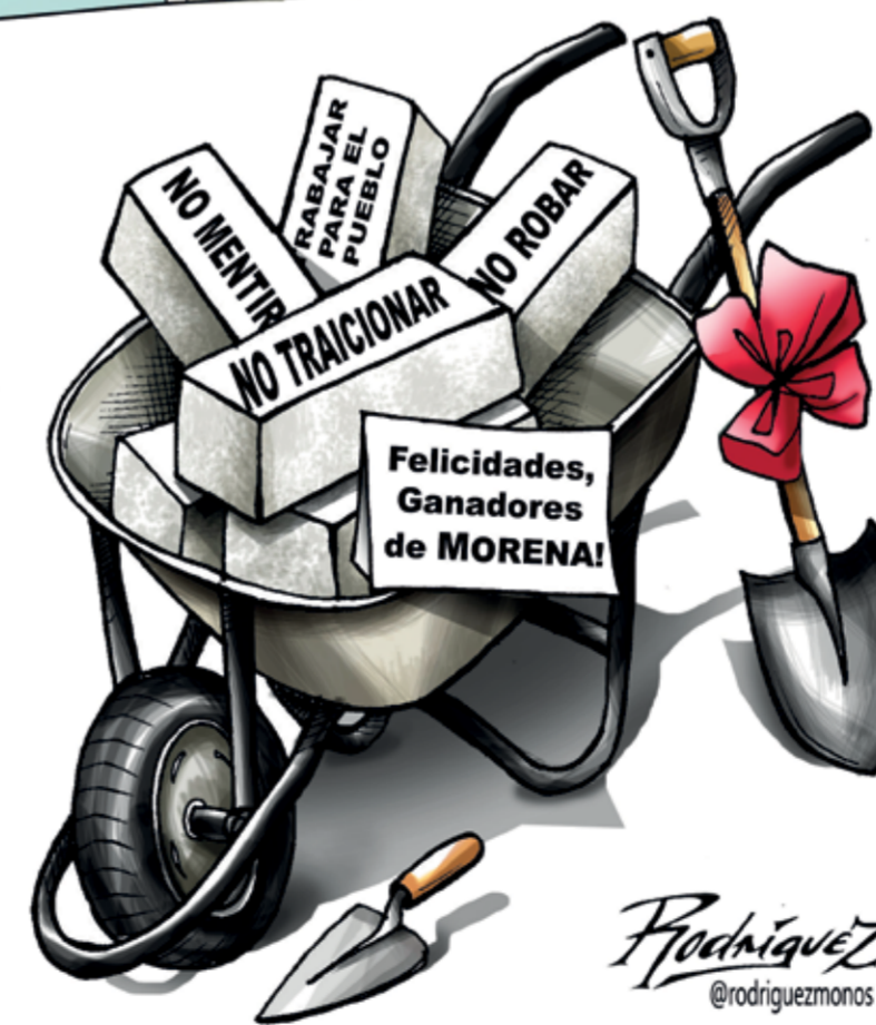
// REGALITO POSELECTORAL //