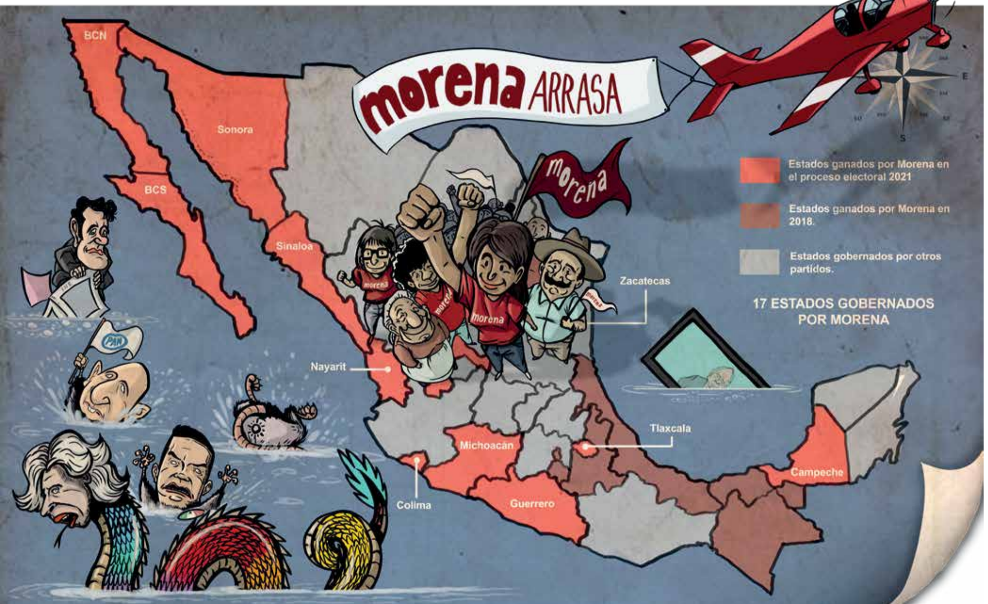
Ilustración Mayo Monero