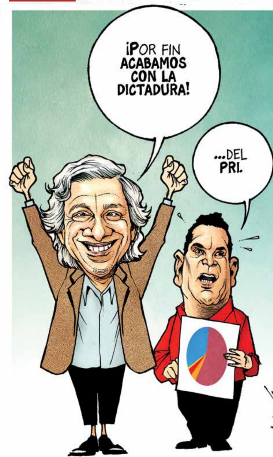
// ¡¡ALBRICIAS!! //

PRI, PAN y PRD no sólo no lograron, como se lo habían propuesto, controlar la Cámara de Diputados, sino que también perdieron casi todos los gobiernos estatales que detentaban. Fue una debacle verdaderamente brutal para ellos