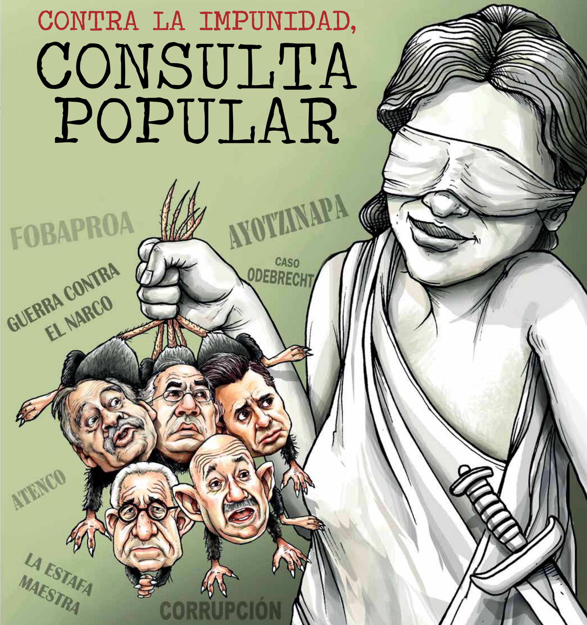
Ilustración Antonio Rodríguez